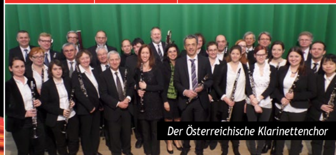
Der Österreichische Klarinettenchor